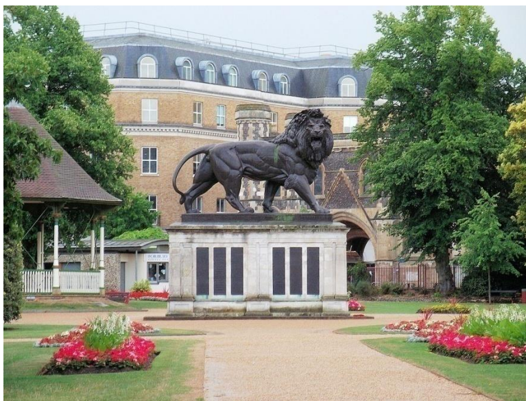
پارک شیر میوند در شهر ریدینگ انگلستان