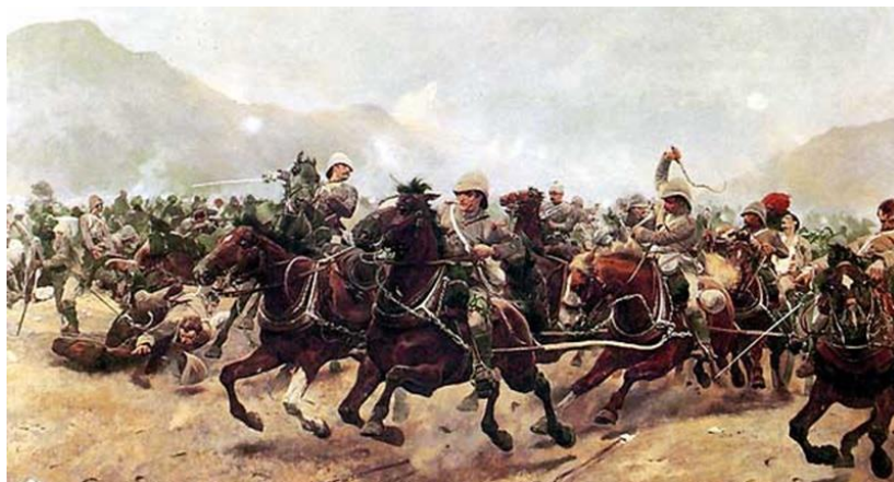
شکست قوای برتانیه در جنگ میوند

رسم انگلیس رچارد کتن ودویل (Richard Caton Woodville) این صحنه شکست قوای سلطنتی انگلستان را نقاشی نموده که ترس و هراس آنانرا در هنگام فرار نشان میدهد.