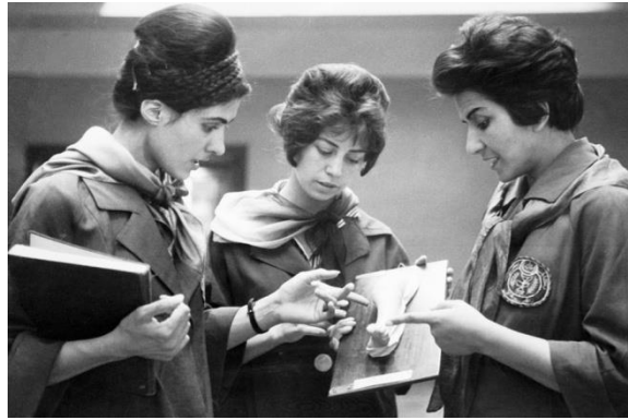
محصلان رشته خدمات صبحی