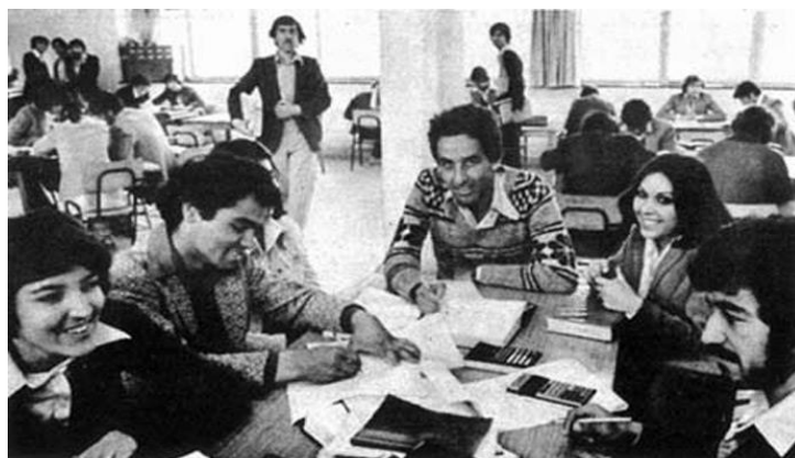
محصیلین پوهنتون کابل و بنیاد های دیگر تعلیمی در دهه ۱۹۷۰

دریندوره دروازه های فعالیت های تعلیمی، اقتصادی، اجتماعی، ورزشی و هنری به روی زنان افغانستان باز گردید. جوانان افغان (ذکور و اناث) در پوهنتون کابل در رشته های انجنیری، طب، ژورنالیزیم، تاریخ و جغرافیه، اقتصاد، فارمسی، انجنیری و مهندسی، ادبیات و علوم بشری، حقوق و علوم سیاسی، زراعت، تعلیم و تربیه، ساینس و شرعیات، و فراگیری زبانهای خارجی مصروف بودند. اکثر این فارغ تحصیلان بخصوص طبقه نسوان در تمام وزارت های افغانستان به کار آغاز کردند.