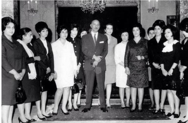
ظاهر شاه وعده ای از بانوان منور در دهه دیمکراسی

در سال ۱۹۶۴ قانون اساسی افغانستان تساوی حقوق را برای مرد و زن تصویب نمود و بعد از آن زنان افغان در کابینه و پارلمان (سنا و شورای ملی) در پهلوی مردان به کار آغاز کردند. در دهه ۶۰ و آغاز ۷۰ افغانستان از جمله نخستین کشورهای شرقی بود که زنان آن در قوای قضایه، مقننه و اجراییه کشور مسؤلیت ادارات مهم دولتی را به عهده داشتند.