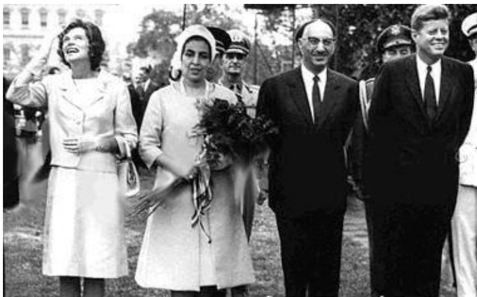
جان اف کنیدی اعلیحضرت و ملکه حمیرا و خواهر کنیدی

در هنگام سلطنت محمد ظاهر شاه افغانستان در سطح جهانی منحيث یک کشور دارای نظام ديموکراسی که در قانون اساسی آن حقوق شهروندی زنان افغان مصئون بود؛ شناخته میشد و ملکه حمیرا در بسیاری از سفرهای رسمی شاه را همراهی میکرد. درین دوره بانوان زیادی در فعالیت های سیاسی، اجتماعی و فرهنگی سهم قابل ملاحظه ای داشتند.