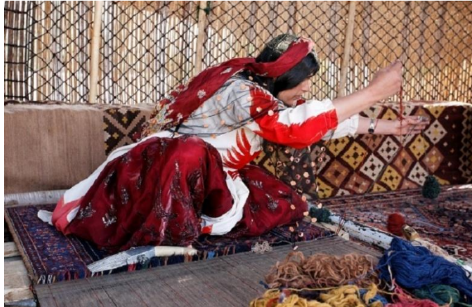
دختر قالین باف از آقچه

در دههٔ هفتاد بر علاوه توجه به زنان شهری برنامه « انکشاف دهات» به کمک سازمان ملل متحد و دولت افغانستان روی دست گرفته شد. هدف عمده این بود تا کورسهای سواد آموزی در قصبات و روستا های دوردست ایجاد شود. چنانچه میدانیم زنان افغان از سالهای بسیار دور در ساحه قالین بافی ، خامک دوزی ، خیاطی ، لیاف دوزی مصروف بودند، این اقدام فرصت های کاری و تعلیمی بیشتری برای زنان در رشته های مختلف زندگی مساعد می ساخت.