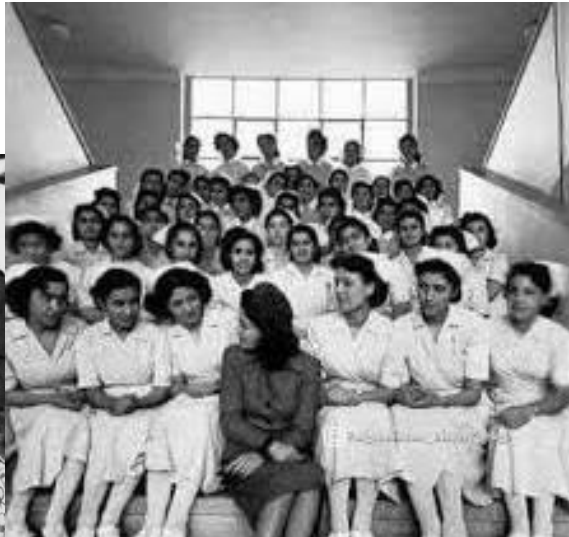
شاهدخت مریم در مراسم فارغ التحصیلی مکتب نرسنگ

در دهه ۱۹۷۰ بوریسیه های تحصیلی برای محصلان ممتاز زن و مرد بیشتر شد. محصلین افغان به غرض اخذ درجه ماستری و دکتورا در کشورهای دوست مشغول تحصیل شدند و درهنگام بازگشت به وطن مصدر خدمات ارزنده ای به کشور گردیدند. در دهه ۷۰ دختران جوان افغان در اکثر تیم های ورزشی مانند والیبال، بسکتبال و سکی اشتراک داشتند و سپورت در تمام مکاتب دختران در سرتاسر افغانستان یکی از فعالیت های مورد علاقه جوانان بود.