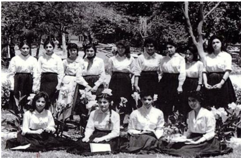
شاگردان لیسه ملالی در زمان سلطنت ظاهرشاه

در زمان اعلیحضرت محمد ظاهرشاه که از سال ۱۹۳۳ تا ۱۹۷۳ دوام کرد، تحولات بیشتری در فعالیت های اجتماعی زنان پدید آمد. مهمترین آن بازگشایی مکاتب دخترانه در خارج از ساحه ارگ بود. بعد ها یکتعدای از فارغ تحصیلات این مکاتب به تحصیلات عالی به سویه لسانس ادامه دادند.