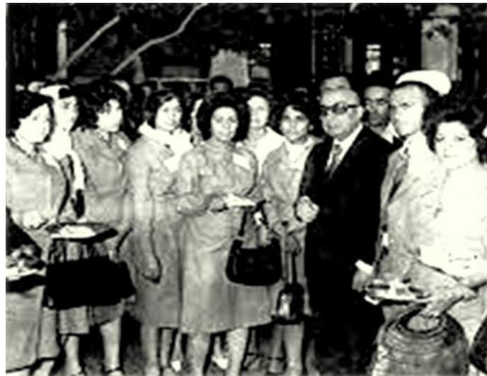
سردار محمد داود خان همراه با عده ای از بانوان فعال در دوره جمهوریت اول

در زمان ریاست جمهوری داود خان ( ۱۹۷۳ تا ۱۹۷۸ ) یکی از اهداف عمده این بود که نسل جوان افغانستان بخصوص زنان سهم زیادی در دفاتر دولتی و سکتور های خصوصی داشته باشند. داود خان یکی از بنیانگذاران آزادی زنان و رفع حجاب مطابق به قوانین شریعت و اشتراک فعال زنان به رضای خودشان بود. دریندوره زنان افغان در اموراداری ، اجتماعی ، فرهنگی و تولیدی به پیشرفتهای بیشتری نایل شدند.