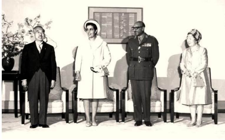
شاه و ملکه افغانستان در سفر جاپان

در زمان ریاست جمهوری داود خان ( ۱۹۷۳ تا ۱۹۷۸ ) یکی از اهداف عمده این بود که نسل جوان افغانستان بخصوص زنان سهم زیادی در دفاتر دولتی و سکتور های خصوصی داشته باشند. داود خان یکی از بنیانگذاران آزادی زنان و رفع حجاب مطابق به قوانین شریعت و اشتراک فعال زنان به رضای خودشان بود. دریندوره زنان افغان در اموراداری ، اجتماعی ، فرهنگی و تولیدی به پیشرفتهای بیشتری نایل شدند.