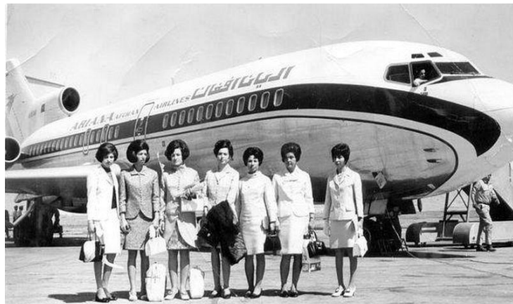
مهمانداران شرکت هوا پیمای آریانا افغانستان