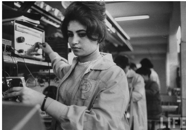
خانم فعالی در دستگاه تخنیکي رادیو تیلیویزیون ملی

بدین لحاظ در وقت ریاست جمهوری سردار محمد داوود زنان بیشتری بحیث استادان پوهنتون و مکاتب ، داکتر ، نرس ، قاضی ، مهندس ، دیپلمات ، نطق ، ممثل ، فلم ساز ، ورزشکار ، شاعر ، نویسنده و آواز خوان شروع به فعالیت نمودند.