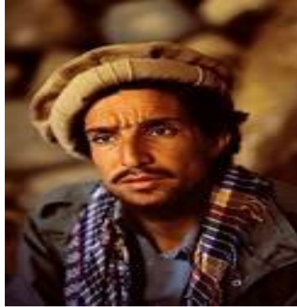
احمد شاه مسعود