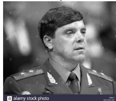
(جنرال گروموف آمر قوای نمبر ۴۰)

به تأسی از تجارب آنانیکه مسعود را میشناخته اند، او از فهم و ذکاوت سرشاری برخوردار بود و زمانیکه محصل پوهنتون کابل گردید، با «گلبدین حکمتیار» یکی از چهره های جریان افراط گرایی و بنیاد گرایی مذهبی وابسته گردید و بر علیه جمهوریت «محمد داود خان» دست تخریبات ناکام زدند و با فرار به پاکستان با همکیش دیگر خود «برهان الدین ربانی» ، هرسه با پذیرش غلامی، آله دست دستگاه جاسوسی پاکستان «آی اس آی» گردیدند. مسعود درین مرحله تمرینات مختلفه پارتیزانی را در