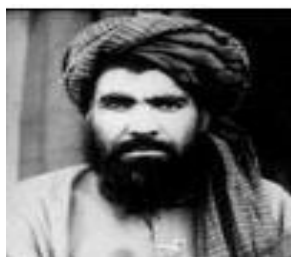
ملا نورالدین ترابی

بعد از مداخله قوای ائتلاف، وی در پاکستان در زندان، و تحت کنترل پاکستان بود در سال 2012 میلادی پاکستان برای خوب شدن روابط بین دو مملکت رهایی هشت زندان طالب را قبول نمود، که در بین آن ها ملا ترابی و ملا عبدالغنی برادر، ملا جهانگیروال (منشی سابق ملا محمد عمر) و ملا الله داد طیب شامل بودند.