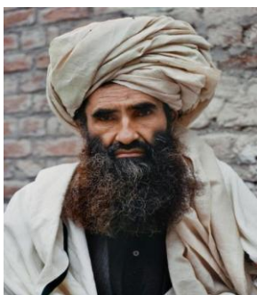
جلال الدین حقانی

جلال الدین حقانی و حزب وی مسولیت خیلی زیاد و جدی در تخطی و نقض حقوق بشر دارند، که شامل اختطاف ها، حملات انتحاری بالای مردم ملکی و به قتل رساندن کارکنان کمک های بشری می باشند.