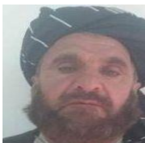
ملا عبدالجلیل حقانی ولی محمد

وی در زمان مقاومت علیه اشغال شوروی ها با ملا محمد عمر در ارتباط شد. در رژیم طالبان به حیث معین وزارت امور خارجه و در آن وزارت نفوذش از متوکل و معین دومی ملا ذاهد زیاد تر بود. به زبان انگلیسی تکلم می کند و بسیار مؤدب و سنجیده و عاقلانه صحبت می کند. میانجی بسیار مهم در نزدیک شدن تحریک طالبان با اعراب بود. بعد تر عضو شورای عالی طالبان، و از سال 2007 میلادی عضو کمیسیون اقتصادی شورای طالبان و مسئول لوژیستیکی طالبان، و از سال 2013 میلادی یک شخص بسیار فعال در معاملات و داد و ستد معرفی شده است.