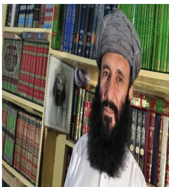
ملا محمد قلم الدین

سال تولد وی 1953 میلادی می باشد. وزیر امر به معروف و نهی از منکر و وزیر عدلیه از سال 1997 الی 2001 میلادی بود، بعد از آن طالبان را ترک کرد.