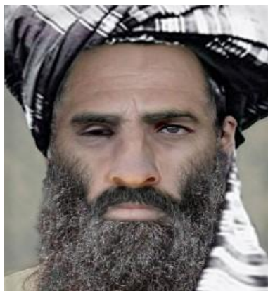
ملا محمد عمر رهبر طالبان

با وجود تأسیس و ایجاد چهار شورا (1) که فرض می شد که هر کدام آن ها یک نقش مختص به خود را داشتند. لاکن ملا محمد عمر سبک خودش را داشت، وی حرف کم می زد، به آرامی عمل می کرد، و زیادتیر به صفت عالم دین عمل می نمود، و از سخنرانی های خود که زیادتیر بالای عقاید مذهبی و دینی استوار بود لذت می برد.