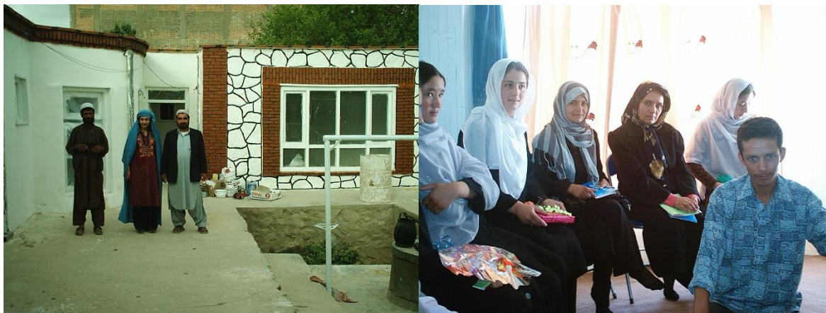
پیشرفت امور ساختمانی مرکز تعلیمی غزنی

این مرکز آموزشی که در مرکز غزنی در قلب بازار کهنه شهر غزنی موقعیت دارد و روزانه در حدود زیادتیر از ۶۰ خانم را پذیرا می باشد. آنهای که از نعمت تعلیم بهره مند اند، در این مرکز به یاد گرفتن انگلیسی و انفارماتیک و خانم های که سواد ندارند کورس های سواد آموزی، و قرار انتخاب خود شان کورس های گل دوزی، زراعت و مالداری، تولید سبزیجات و قوریه جات و برخی هم به کمک های اولیه صحی مشغول آموزش اند.