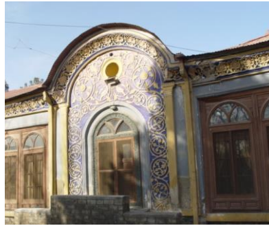
گوشه ای از قصر بوستان سرای

اش را تمثیل میدارد. درینجا چند بیتي از اشعار او را از کتاب «پرده نشینان سخنگوی» اثر ارزشمند خانم ماگه رحمانی پیشکش مینماییم: ۱