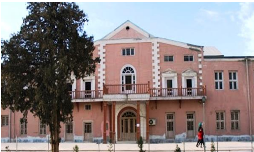
قصر شاه بوبو جان، در شهر نوکابل

به اساس معلوماتی که در موزیم اتنوگرافی افغانستان نوشته شده شاه بوبو جان، خواهر امیر عبدالرحمن خان بود. شاه بوبو جان نیز مانند ملکه حلیمه به عمارانات علاقه مفراطی داشت و به خواهش او، قصرشکوهمند و زیبایی در شهر نوکابل اعمار یافت که تا هنوز بنام قصرشاه بوبو جان یاد میشود .