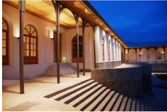
قصر ملکه در باغ بابر

درینمورد چنین میتوان گفت ، که این باغ گواه محبت دو شاه مقتدر به همسران شان میباشد. یعنی ظهیرالدین بابر و امیرعبدالرحمن خان که صدها نفر از هیبت شان به خود میلرزید ، اما آنقدر به ملکه های شان حرمت و محبت داشتند که هردو برای خوشنودی همسران خود بر زیبایی و شکوهمندی این باغ تاریخی افزوده اند.