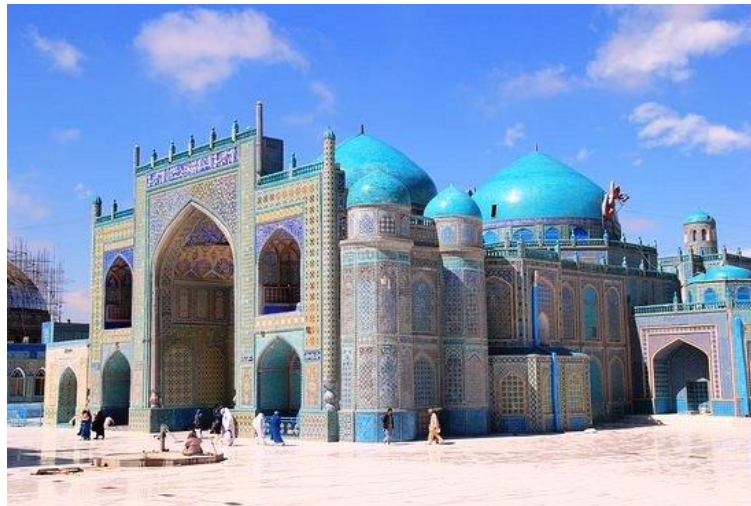
روضه حضرت شاه ولایتآب در مزارشریف

درحقیقت اکثریاباغهای کابل مانند باغ بابر، باغ شهرار، مهتاب باغ ، باغ جهان نما همه به همت بانوان این سرزمین اعمار گردیده واقتدار زنان افغانستان را دردوره های مختلف تاریخ به نمایش می گذارند. همچنین در ولایات افغانستان بیشتر باغهای زیبا و پر ثمر چون بلخ، هرات، کندهار و جلال آباد به توجه زنان صاحب اقتدار ایجاد گردیده اند. زیرا زنان طبیعتاً زیبایی را می پسندند و به ایجاد وخلق کردن علاقه مندی فراوان دارند. یعنی دارای فطرت سازنده و پویا هستند و با ویرانگری و تخریب سروکار کمتری دارند. ملکه حلیمه درسر راه کابل و پغمان پلی اعمار کرد که تا امروز بنام «پل حلیمه» یاد میشود. او برعلاوه توجه به کاخ ها وباغهای کابل به ولایات کشور نیز توجه داشت و برای روضه حضرت علی (کرم الله وجهه) تحایف گران بهایی اهدا کرد که تا کنون در موزیم آرمگاه شاه ولایت معاب در مزار شریف وجود دارد.