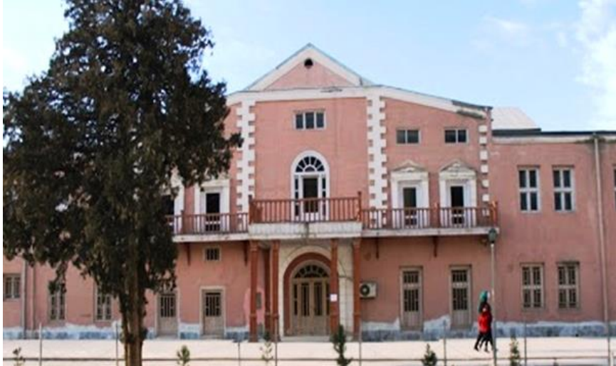
قصر شاه بوبو جان، در شهر نوکابل

به اساس معلوماتی که در موزیم اتنوگرافی افغانستان نوشته شده شاه بوبو جان، خواهر امیر عبدالرحمن خان بود. شاه بوبو جان نیز مانند ملکه حلیمه به عمارانات علاقه مفراطی داشت و به خواهش او، قصرشکوهمند و زیبایی در شهر نوکابل اعمار یافت که تا هنوز بنام قصرشاه بوبو جان یاد میشود .