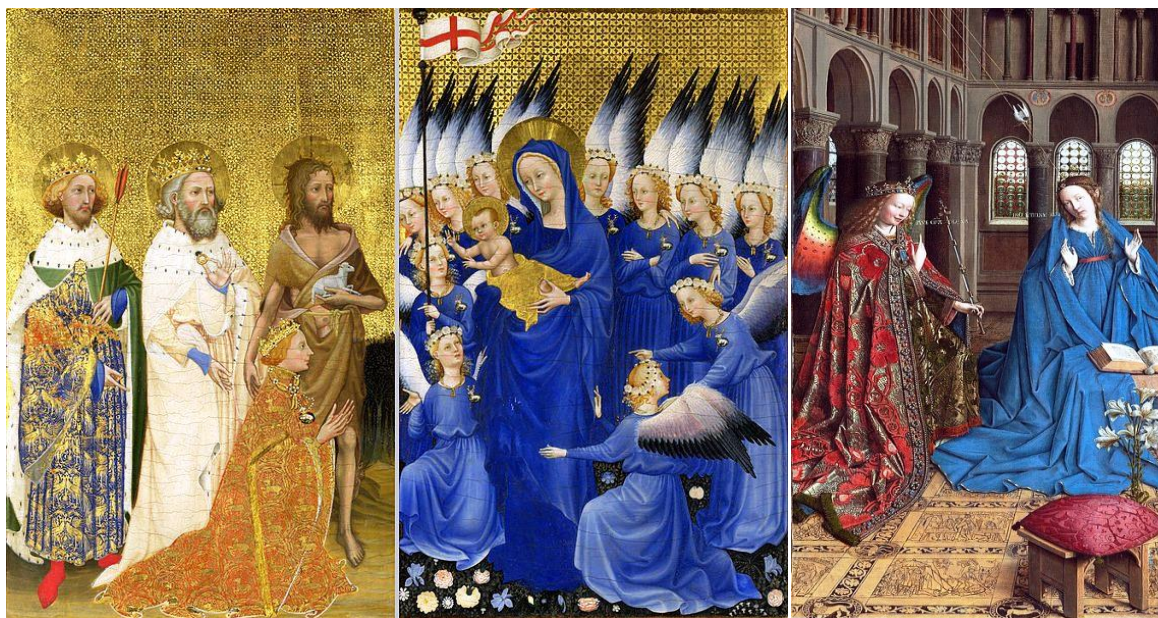
آثار هنری عصر آغاز رنسانس با استفاد از رنگ لاجورد

اصطلاح آلترا مرین ultramarine در لغت معنی ماورای ابحار را ارائه می‌دارد. در سده های سیزدهم و چاردهم رنگهای زیادی در اروپا کشف شده بود ، اما درین میان سه رنگ نیلگونی که از قاره آسیا از طریق جاده ابریشم به سواحل شرقی مدیترانه می آمد از اهمیت خاصی برخوردار بود. این رنگها عبارت بودند از: رنگ نباتی اندیگو Indigo که از هند می آمد ، رنگ فیروزه ئی که از ترکیه وارد میش و بنام ترکویز Turquoise یاد میگردید و رنگ آلترا مرین که از بامیان به هرات آورده میشد و از آنجا تا انا تولیه و بالاخره به اروپا میرسید. در دوره رنسانس نقاشان قرن پانزدهم ایتالیایی گرانبها ترین تابلو های مریم مقدس را با این رنگ گرانبها پیرایش میدادند ، تا شکوه شخصیت ، پاکی باطن و حالت غم انگیز اورا تجلی دهند. در همین آوان در آغاز دوره رنسانس یعنی اخیر قرن چهاردهم میلادی که تجارت راه ابریشم رونق دوباره یافته بود، و همچنان یادداشتهای مارکوپولو ، سیاح ایتالیایی علاقه مندی اوروپایی ها را به بلاد مشرق زمین بیشتر ساخته بود ، نقاش هالندی وان آیک Van Eyck تابلوی "مریم مقدس و جبرئیل" را با انتخاب رنگ لاجوردی روشن برای رنگ آمیزی پیراهن مریم باکره استفاده کرد که مورد توجه فراوانی قرار گرفت. سپس به امر ریچار دوم شاه انگلستان نقاشی " تولد مسیح" با استفاد از رنگ لاجورد و رنگ طلایی خالص بالای تخته های نازک چوب برای نماز گاه ویلتون هاوز Wilton House آفریده شد. هرچند نام نقاش این اثر معلوم نیست، اما بخاطر استفاده از رنگ های اصیل تا حال تراوت خود را از دست نداده است.