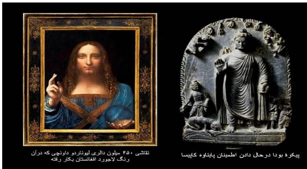
نقاشی ۴۵۰ میلیون دالری لیوناردو داوینچی که در آن رنگ لاجورد افغانستان بکار رفته

در سال ۲۰۱۶ یکی از تابلوهای نقاش معروف ایتالیا، لیوناردو داوینچی بنام «سلواتورمندی» Salvator Mundi که در آن از رنگ اصیل لاجورد افغانستان استفاه بعمل آمده است در هراج نیویارک ۴۵۰ میلیون دالر امریکایی تعیین گردید. بدیهیست که بر علاوه شهرت بسزای لیونادو داوینچی، خالق تابلوی معروف «مونه لیزا» یا «لبخند ژکوند» موجودیت رنگ اصیل لاجورد بدخشان بر قیمت این اثر ارزشمند هنری افزوده است. سلواتورمندی بمعنی «نگهدارنده یا محافظ جهان» در هنر کلیسایی اروپا به نقاشی های از حضرت مسیح اطلاق میگردد که دست راست را به علامت دادن اطمینان بلند نموده و در دست چپ کره زمین را نگهداشته است.