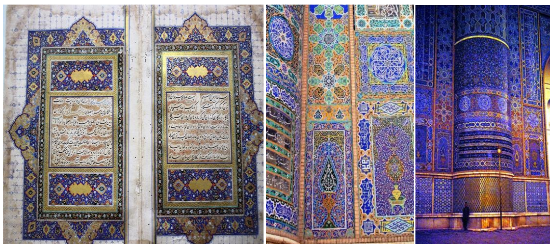
نمونه ای از نسخ خطی قرن پانزدهم و بخشی از کاشیکاری های ظریف مسجد جامع هرات و مزار شریف

پربهاترین تزئینات نسخ خطی عهد تیموریان هرات با استفاده از رنگ لاجوردی همراه با تزیینکاری حاشیه ها نشاندهنده اهمیت گرده لاجورد درین عصر است و بهمینگونه استفاده از رنگ لاجوردی درکاشی کاری های مساجد و زیارتگاه های این دوره گواه این مطلب میباشد.