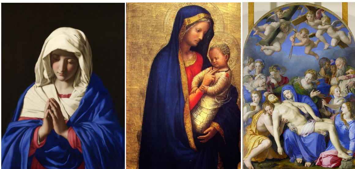
تابلو های مریم مقدس با استفاده از رنگ لاجورد در دوره رنسانس

در جهان امروز انواع رنگهای کیمیایی در صنعت رنگسازی معمول است، اما در عصر تیموریان هرات که نقاشان بزرگی چون موسی مصور ، مولانا ولی الله ولی ، روح الله میرک هروی و نابغه هنر نقاشی استاد کمال الدین بهزاد ظهور نمودند، رنگها از احجار کریمه، عصاره نباتات و شیرۀ گیاهان ایجاد میشد. برخی از این رنگها با کاروانهای مال التجاره به شهر انطاکیه میرسید و از آنجا توسط کشتی به ایتالیا انتقال میافت. البته در اروپا نیز رنگهای زیادی مانند رنگ Vermillion و رملیون (سرخ) فرانسه و روم، رنگ سبز زمردین Emerald Green، رنگ آبی کبود Cobalt Blue ، رنگ نصورای وان Van Eyck Brown و انواع رنگهای بنفش و زرد از زمره رنگهای گرانبها بودند، اما درین میان رنگ لاجوردی چون از راه دوری می آمد بنام آلترا مرین Ultramarine Blue یعنی رنگ (آنسوی دریاها) یاد میگردید ارزش معنوی خاصی داشت و نقاشان قرن پانزدهم گران بهاترین تابلو های مریم مقدس را با این رنگ پیرایش میدادند تا شکوه شخصیت، پاکی باطن و حالت غم انگیز مادر مقدس را تجلی دهند. این رنگ در میان نقاشان اروپا بخاطر درخشش بینظیر آن نیز شهرت زیادی داشت و تنها استادان کار به آن دسترسی داشتند. نقاشان معروف ایتالیا و هالند مانند مساجیو Masaccio، جیوانی ساسوفیرا و Geovani Sassoferrato و جان ویرمیر Vermeer Johan تصاویر بسیار برگزیده و دارای تقدس را با این رنگ میآفریدند. بطور مثال در تابلو های مریم مقدس چادر مریم عذرا با رنگ لاجوردی افغانستان نقاشی میشد و در زمینه آن رنگ طلائی کار میشد و بخاطر داشتن دو رنگ اصیل، ترکیب یافته از الیاژ طلا و لاجورد تاکنون از ارزش فراوانی برخوردارند.