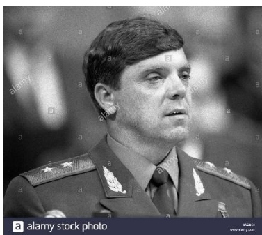
جنرال بوریس گروموف آمر قوای اشغالگر نمبر 40 شوروی در افغانستان

در مورد روابط دستگاه های جاسوسی امریکا و انگلستان یعنی «سی آی ای- ام آی 6» در آغاز حضور شوروی در افغانستان، صراحت و اسناد زیادی موجود است و مسعود هم گویا ابتداء در جنگ علیه اتحاد شوروی شامل بوده و کمک های ممالک مختلفه را دریافت می نموده است، ولی راپور ها مشعر است که یکباره از جنگ واقعی دست میکشد و موجبات تشویش آن ممالک را فراهم مینماید. «مردی که نمی جنگد» اثر معروف بروس ریچاردسن افغانستان شناس و ژورنالیست خبره درین زمینه وضاحت و استناد دارد که درین مختصر نمیگنجد، بلکه باید به ارتباط نزدیکی احمد شاه مسعود به « بوریس گروموف» جنرال روسی و قوماندان قوای نمبر 40 اتحاد شوروی در افغانستان، روشنی مختصری بر یکی از مصاحبه های جنرال مذکور با نشریه «سپوتنیک» در مورد روابط سری وی با مسعود، بعد از امضای پروتوکول های مختلفه و هم بعد از شکست خفتبار ابر قدرت روس در افغانستان، انداخت.