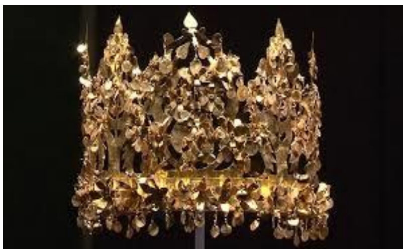
تاج طلای شاهدخت آریایی جزئی از گنجینه باختر - طلا تپه

بعد ها با عطش سیری ناپذیری که دیدار و مطالعه این آثار گرانبهای وطن خودم خلق مینمود، تصادفاً در «برتش میوزیم» لندن موفق به مطالعه و بررسی بیشتر آنها گردیدم که با قدمندی و ترتیبات